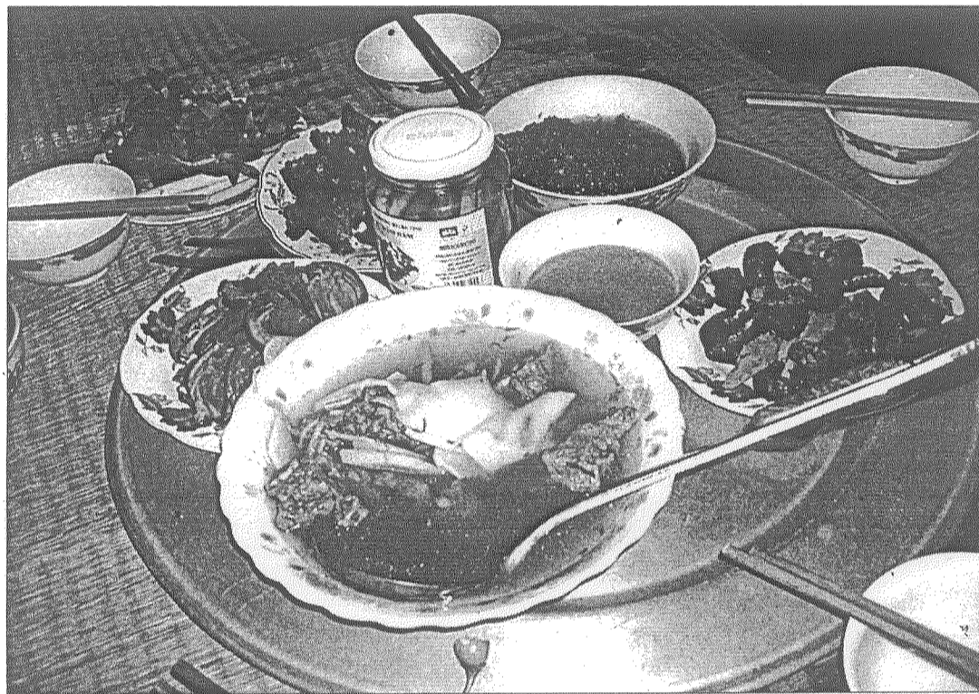
Dans la tradition culinaire, on dénombre sept plats différents à base de chien.